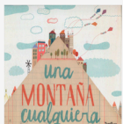
Una montaña cualquiera Fran Pintadera Il. Txell Darné Takataka, 2017

Continúa la historia de la pareja que descubrimos en “La ovejita que vino a cenar”. Lobo y Estofado encuentran un huevo. Deciden cuidarlo y darle calor y de él sale... ¡un cocodrilo!. Una historia repleta de valores como la aceptación de las diferencias, la amistad y la generosidad.