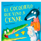
El cocodrilo que vino a cenar Steve Smallman Il. Joelle Dreidemy Beascoa, 2020

Continúa la historia de la pareja que descubrimos en “La ovejita que vino a cenar”. Lobo y Estofado encuentran un huevo. Deciden cuidarlo y darle calor y de él sale... ¡un cocodrilo!. Una historia repleta de valores como la aceptación de las diferencias, la amistad y la generosidad.