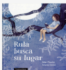
Rula busca su lugar Mar Pavón Il. María Girón Tramuntana, 2015

Un libro donde poder viajar a diferentes hábitats del mundo: la jungla, lo más profundo del océano... y descubrir todos los animales que viven en estos lugares desde una perspectiva diferente. Un libro para disfrutar toda la familia.